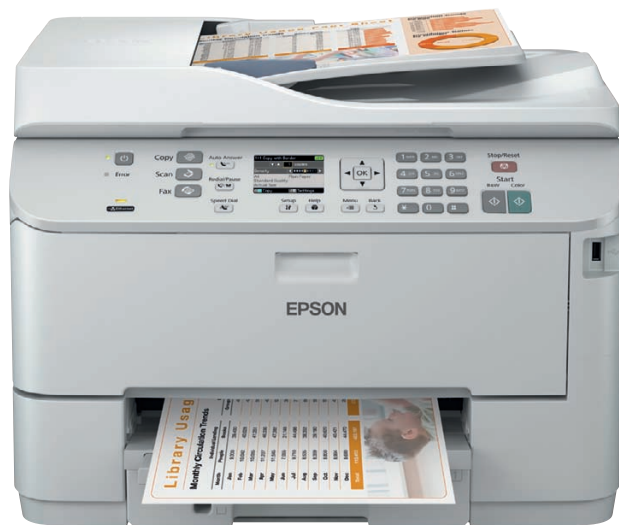
Il modello illustrato è WP-4595 DNF

Epson WorkForce Pro WP-4095 DN e WP-4595 DNF hanno proprio tutto quello che serve in ufficio: design da stampante laser, emulazioni, prestazioni elevate, affidabilità e costi di gestione inferiori fino al 50% 1 .